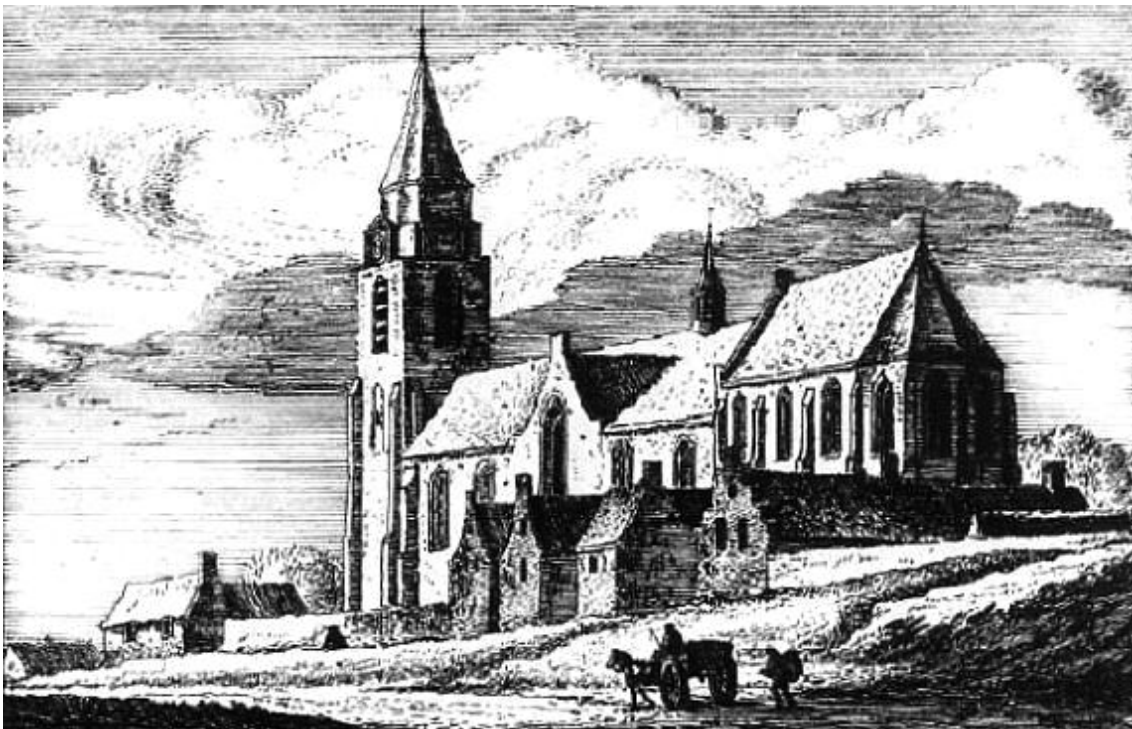
De Scheveningse kerk in 1639 uit het Z. gezien. Ets van A. Rademaker in 's Rijks Prentenkabinet. (Abraham Rademaker leefde van 1676 tot 1735 . De ets is waarschijnlijk gemaakt in 1715)