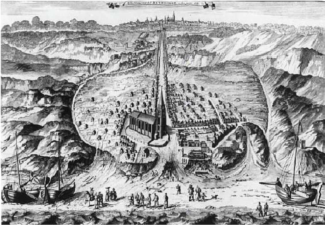
Scheveningen in 1729. Gravure in de Remer.