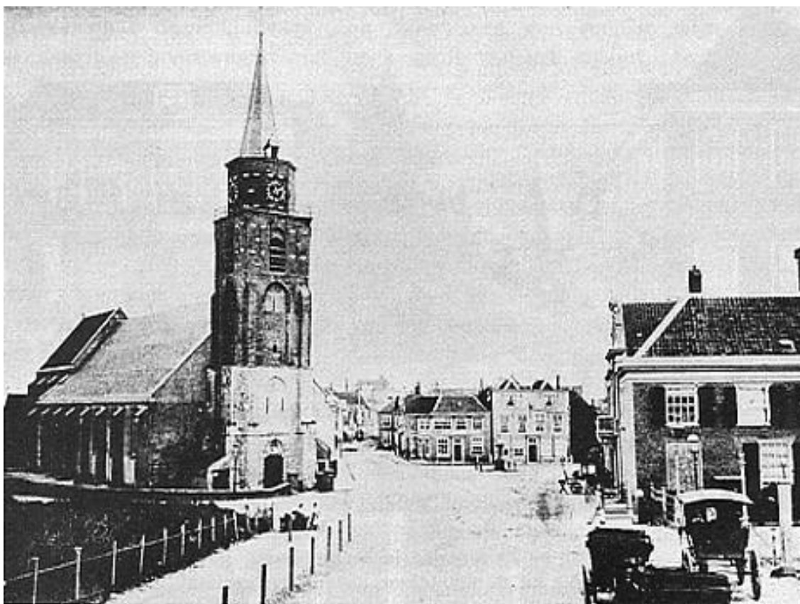
De Keizerstraat in 1860.

Wij besluiten met een foto te geven van de Keizerstraat van de zeezijde gezien, van het jaar 1860.