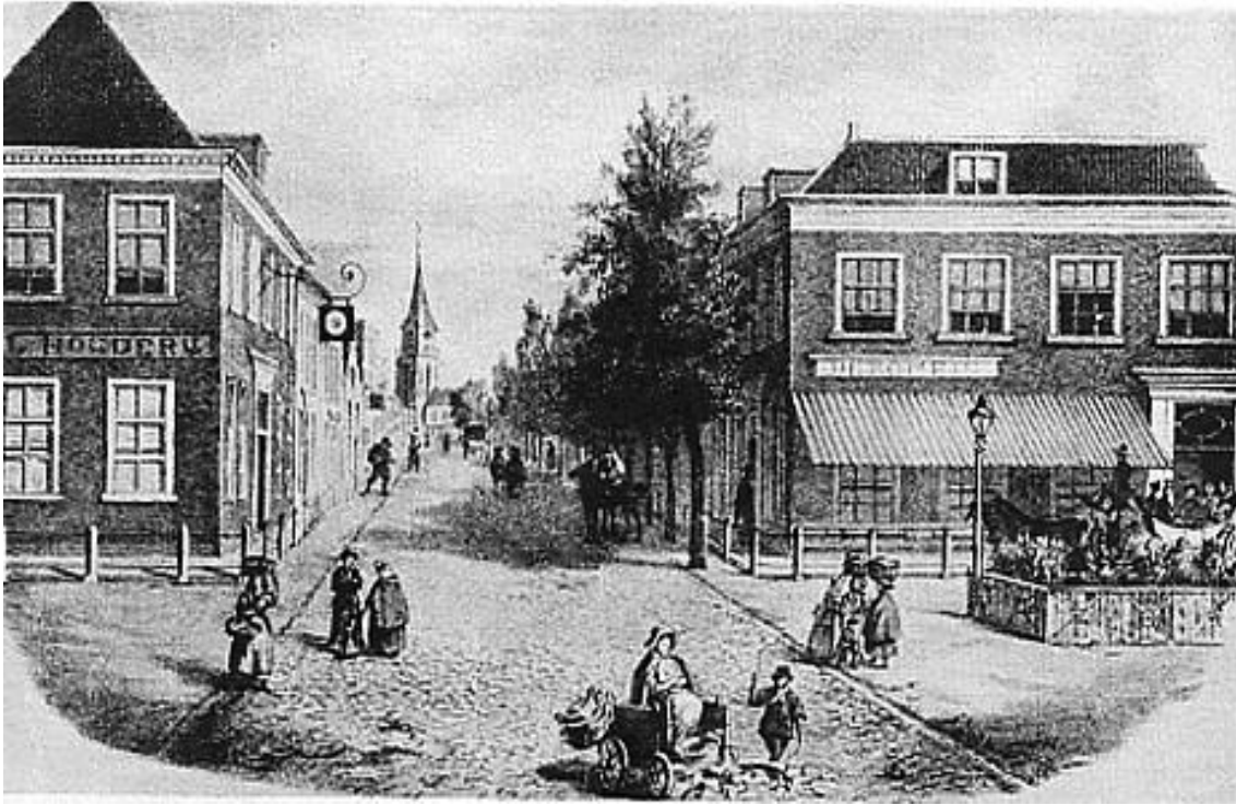
De Keizerstraat in de 19e eeuw. Steendruk uit prentenverzameling der gemeente.

We gaan 'n tachtig jaar verder. Dat is een menschenleven; daarin kan heel, wat gebeuren, en dat zien we op nevenstaanden plattegrond,