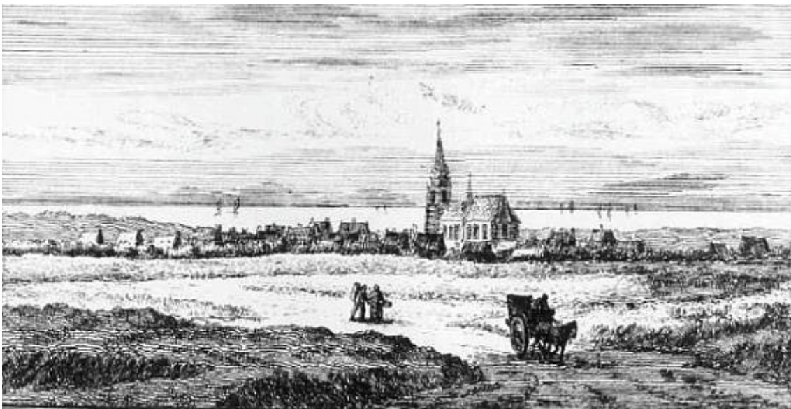
Scheveningen in 1630 van de landzijde gezien. Ets van A. Rademaker in 's Rijks Prentenkabinet. (Abraham Rademaker leefde van 1676 tot 1735 . De ets is waarschijnlijk gemaakt in 1707)

Dien indruk krijgt men eveneens bij de beschouwing van de drie hier volgende afbeeldingen; ze zijn van het jaar 1630 en geven Scheveningen van verschillende zijden te zien.