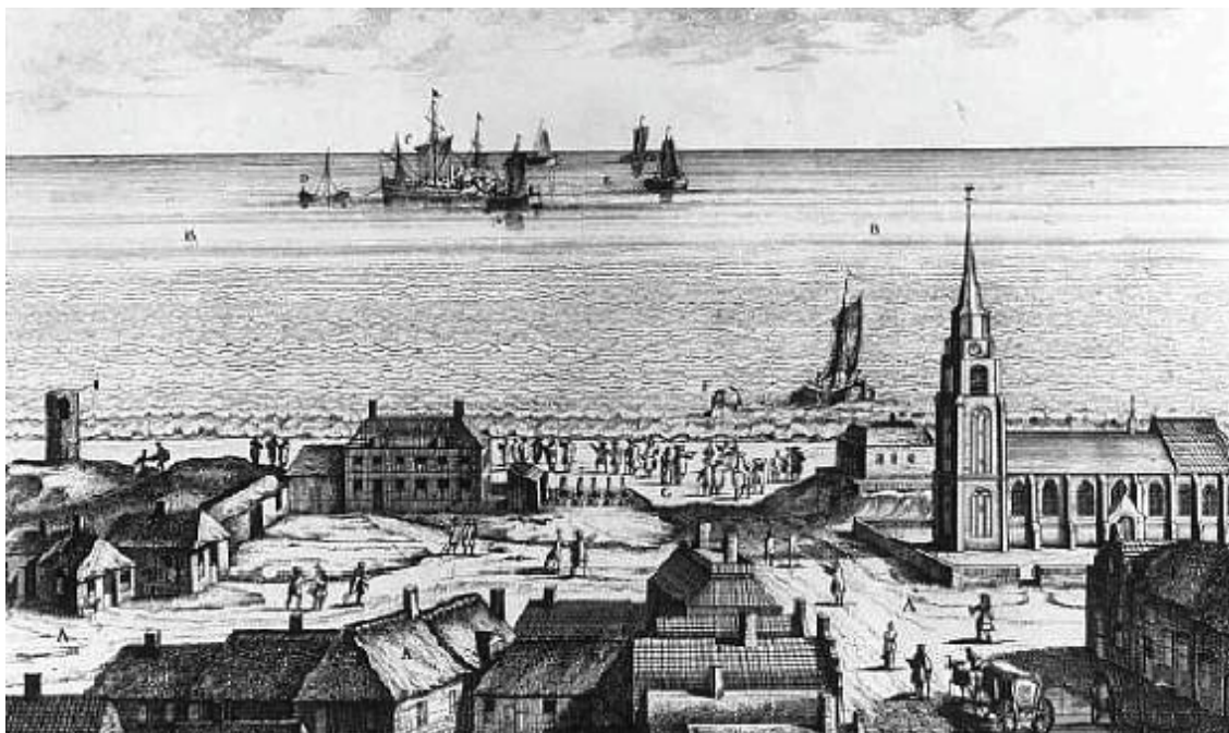
Scheveningen in 1704

De prent hieronder van 1704, ook door ons gevonden in het Rijks Prentenkabinet te Amsterdam, geeft den toenmaligen toestand duidelijk weer.