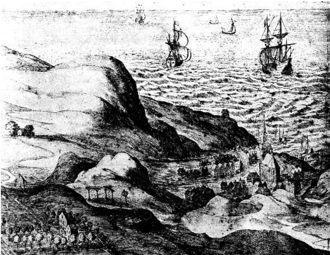
Scheveningen 1614. Prent door J. Van Londerseel en N. DeClerck in de prentenverzameling van de gemeente.

Zeker karakteristiek is de afbeelding van Scheveningen bij vogelvlucht uit dien tijd. Natuurgetrouw als Londerseel toekende, vergat hij hier ook niet de galgen te doen uitkomen, als iets afschrikwekkends voor de boosdoeners. "Scheveringe", zooals hij het noemt, had in zijn tijd nog niet den omvang teruggekregen, dien het had kort vóór den Allerheiligenvloed.