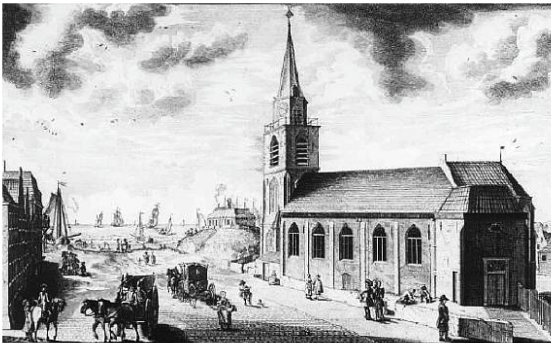
Scheveningen in de 18e eeuw. Prent van H. Scheurleer

zijn maar zeven pinkjes te zien, zoo stijf als houten Klaasjes; maar we zijn de gebroeders Cruquius toch dankbaar voor hun werk en gaan weer een veertigtal jaren verder om de bedrijvigheid omstreeks het jaar 1750 op de Kerkwerf te zien.