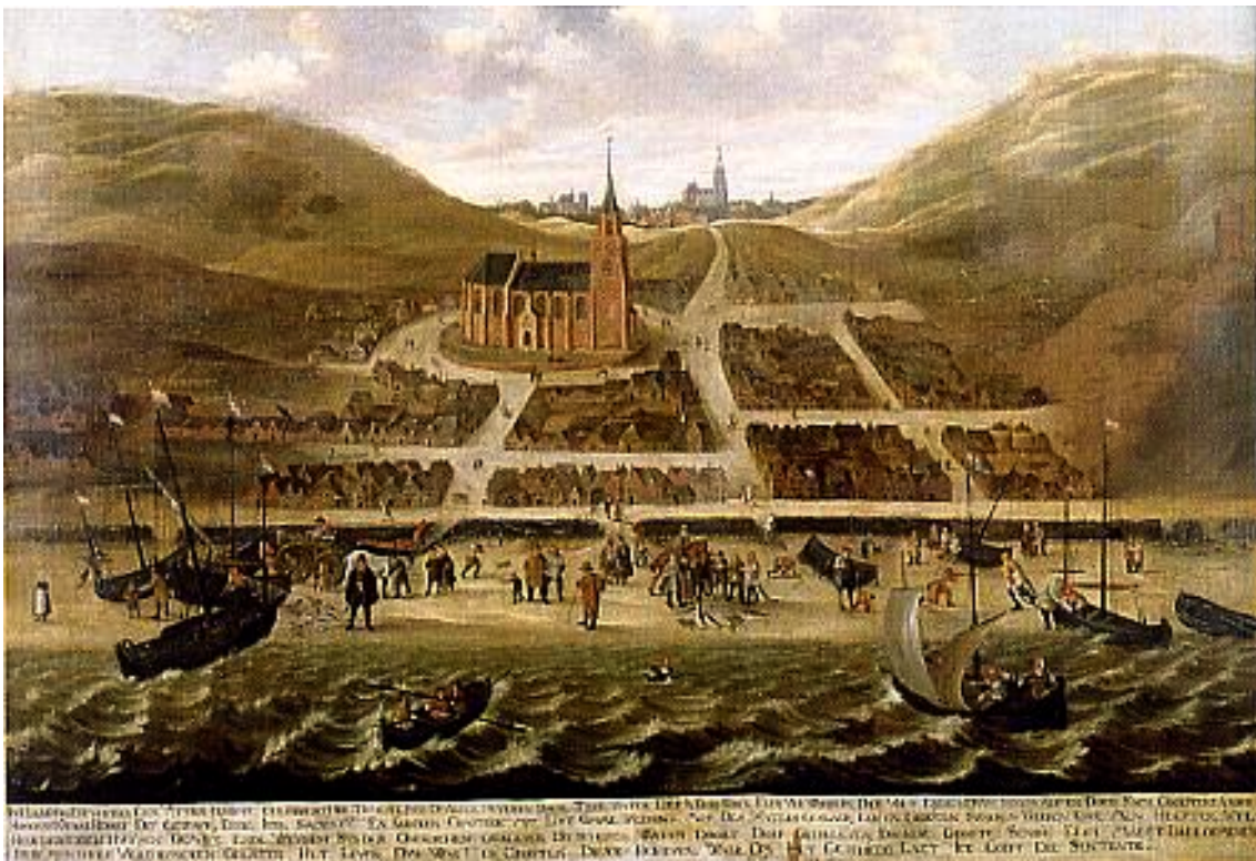
Scheveningen vóór de Allerheiligenvloed. Schilderij door Cornelis Elandts. In het Gemeente-Museum. (Het schilderij is nu in het Haags Historisch Museum)

Het oorspronkelijke schilderij moet indertijd in de Oude kerk alhier gehangen hebben en in het einde van de 18e eeuw vergaan zijn. Het schilderstuk van Elandts hing voorheen op het Stadhuis.