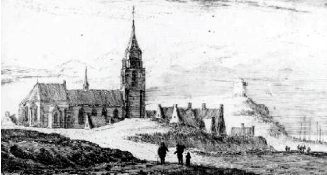
De Scheveningse kerk in 1630 uit het N. gezien. Ets van A. Rademaker in 's Rijks Prentenkabinet. (Abraham Rademaker leefde van 1676 tot 1735 . De ets is waarschijnlijk gemaakt in 1727)